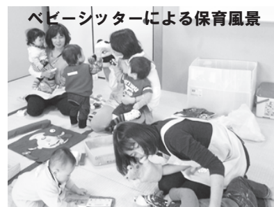
ベビーシッターによる保育風景