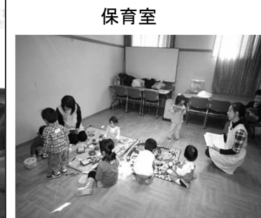
(日程・会場により広さ等は異なります)